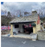
ミニクーパーガレージ