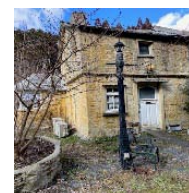
温室風出窓の部屋