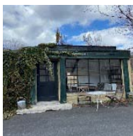
グリーンショップ